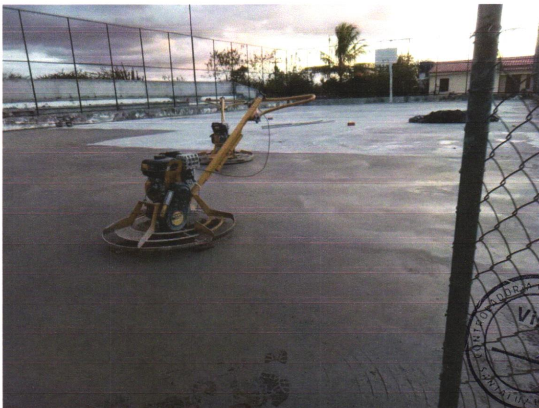
Foto 06 - PISO EM CONCRETO 20 MPA PREPARO MECÂNICO, ESPESSURA 7CM. AF_09/2020