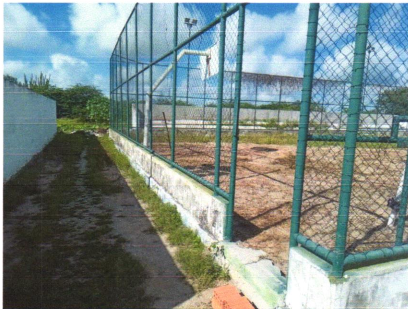
Foto 01 - LIMPEZA MANUAL DO TERRENO COM RASPAGEM SUPERFICIAL (CAPINAÇÃO)