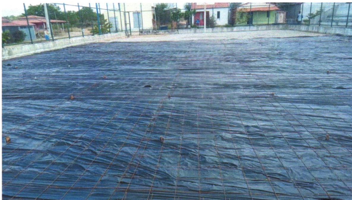
Foto 04 - APLICAÇÃO DE LONA PLÁSTICA PARA EXECUÇÃO DE PAVIMENTOS DE CONCRETO. AF-11/2014