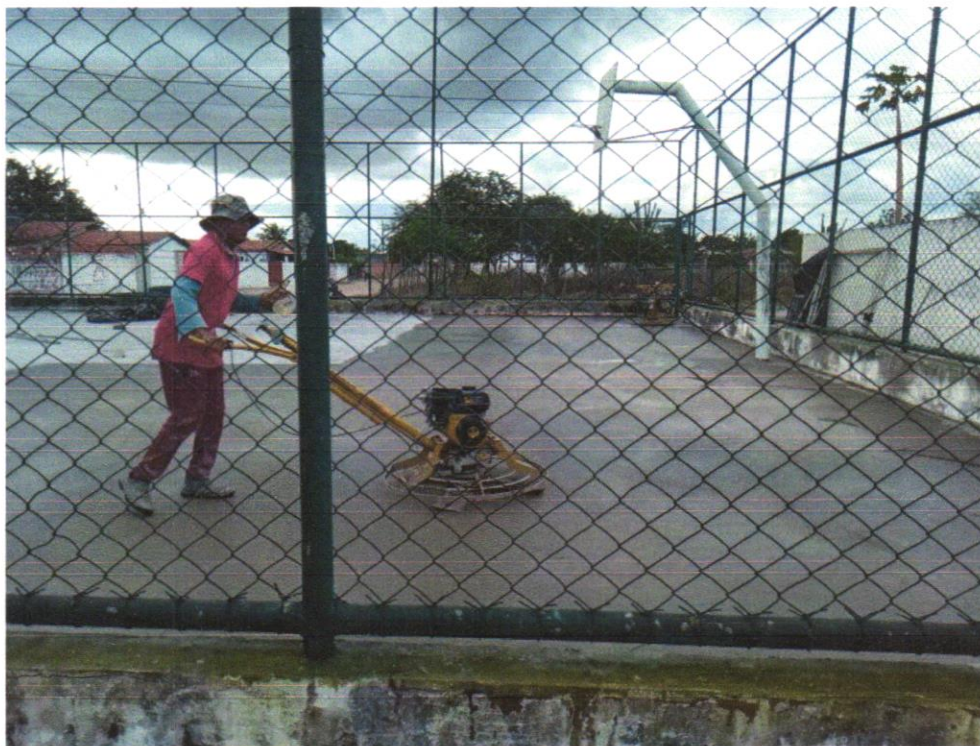
Foto 09- ACABAMENTO POLIDO PARA PISO DE CONCRETO ARMADO DE ALTA RESISTÊNCIA. AF_09/2017