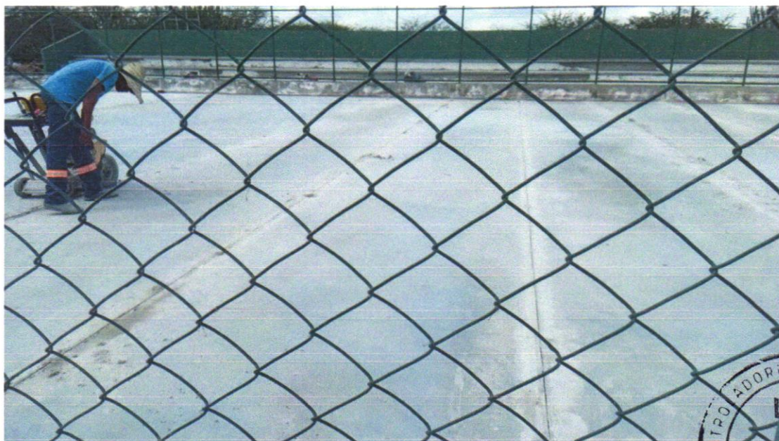
Foto 08 - EXECUÇÃO DE JUNTAS DE CONTRAÇÃO PARA PAVIMENTOS DE CONCRETO. AF_11/2017