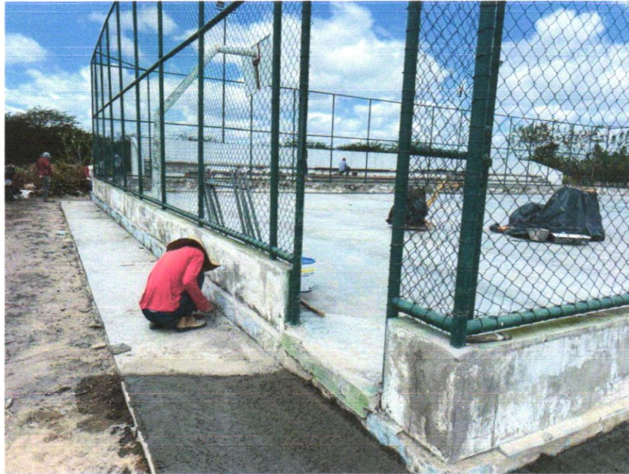
Foto 11 - ALAMBRADO PARA QUADRA POLIESPORTIVA, ESTRUTURADO POR TUBOS DE AÇO GALVANIZADO, (MONTANTES COM DIÂMETRO 2", TRAVESSAS E ESCORAS COM DIÂMETRO 1 ¼ ), COM TELA DE ARAME GALVANIZADO, FIO 10 BWG E MALHA QUADRADA 5X5CM (EXCETO MURETA). AF_03/2021

Evaldo Almeida Moraes Engenheiro Civil RNP 051419303-3